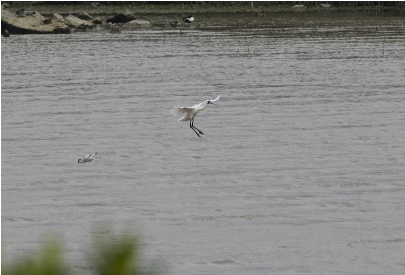
Der sehr seltene Schwarzgesicht-Löffler